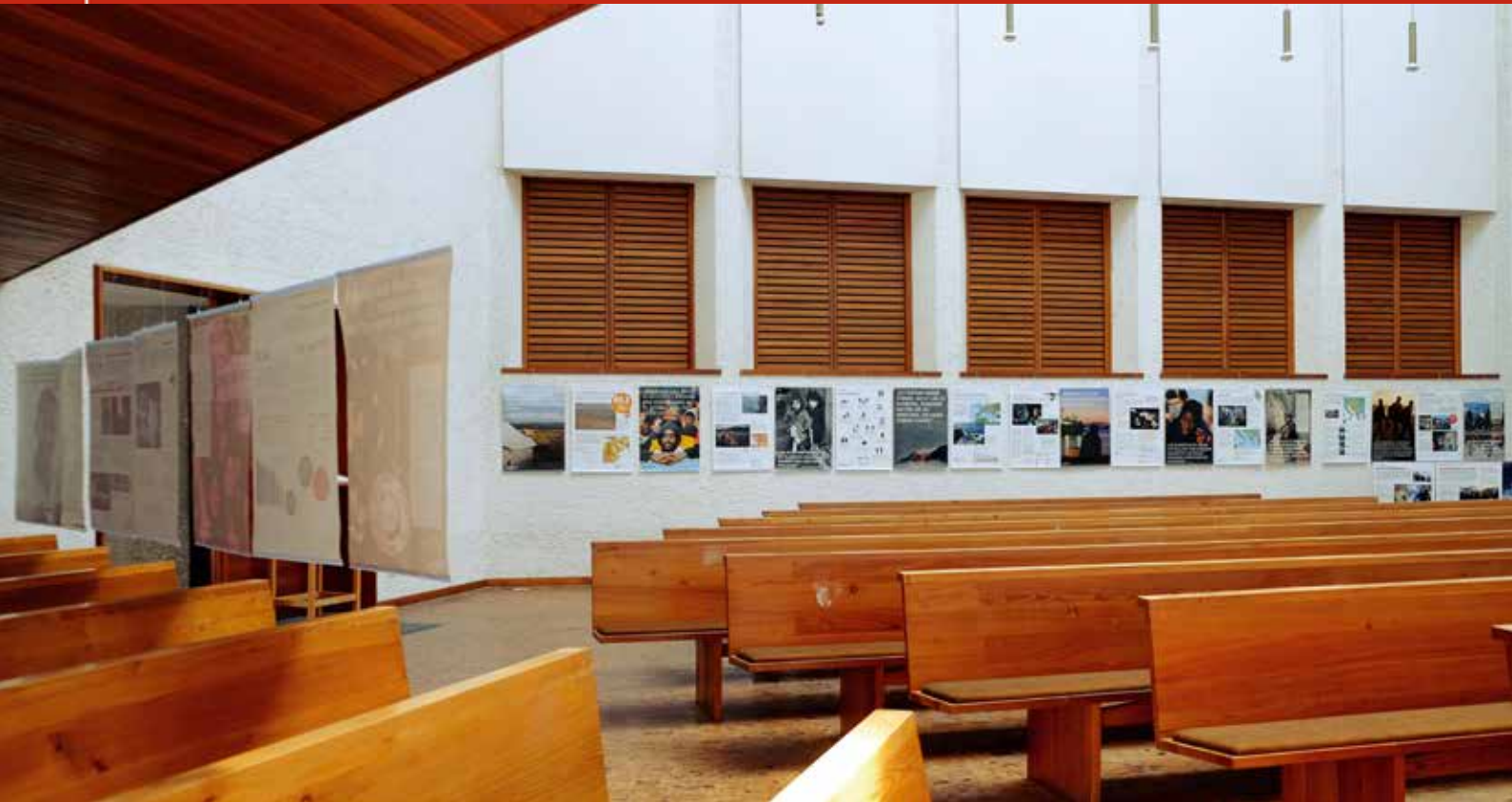
"Asyl ist Menschenrecht" in der Markuskirche im Juni

Nachrichten für die Evang.-Luth. Gemeinde in Prüfening und Sinzing