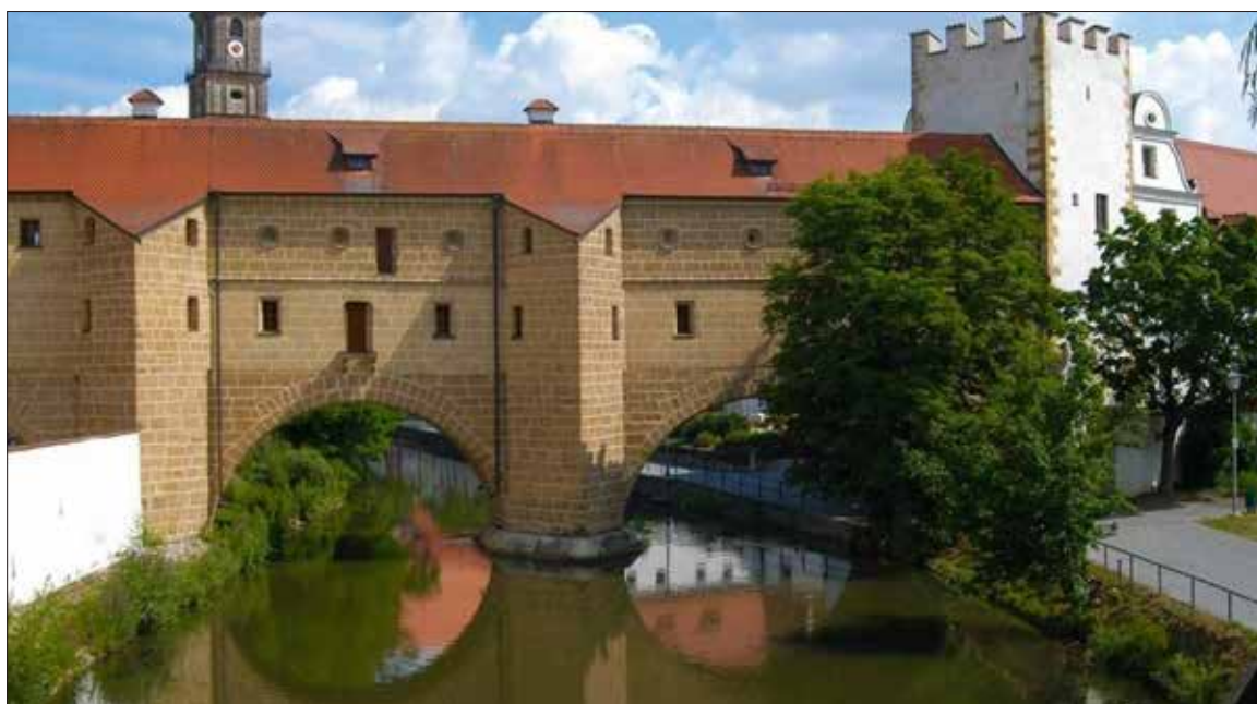
Amberg, die "Brille"

Ein detailliertes Programm wird noch bekannt gegeben.