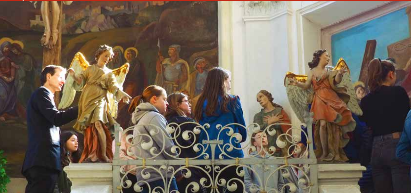
Konfirmanden und Engel in der Kalvarienbergkapelle

Nachrichten für die Evang.-Luth. Gemeinde in Prüfening und Sinzing