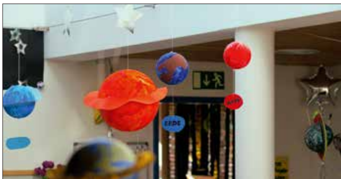
Das Thema Weltall im Kindergarten

Am 23.7. um 20 Uhr laden wir die Eltern unserer Konfirmanden zu einem Informationsgespräch ins Gemeindehaus ein.