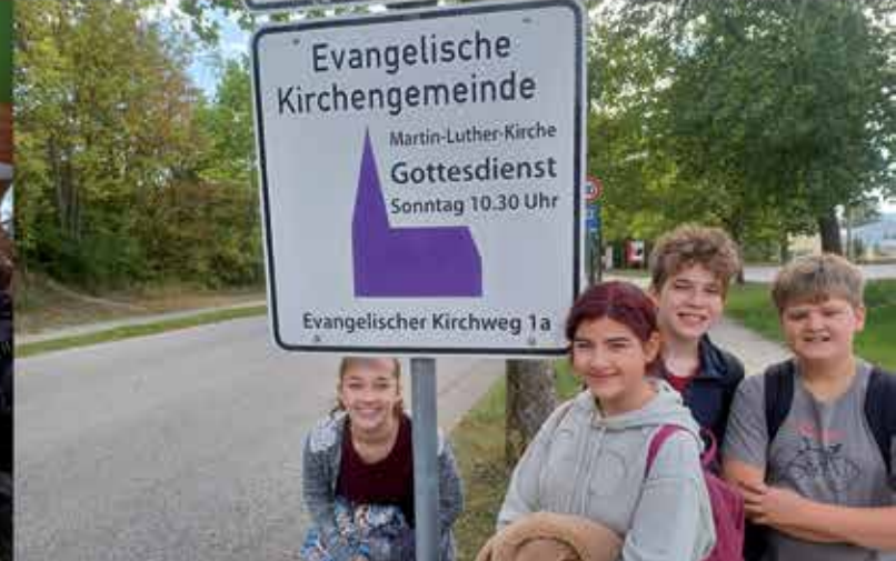
Ausflug der Prüfeninger Konfirmanden ins Fair-Handelszentrum in Langquaid