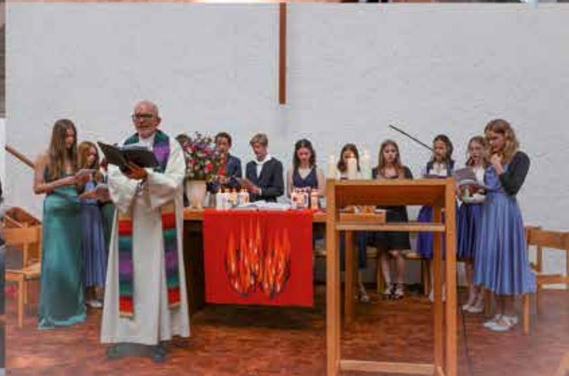
Unsere Konfirmationen in Prüfening 2024